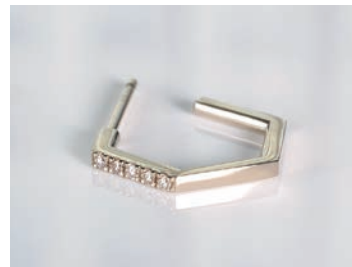
フレーム [BCI 003] K18BG BD0.08ct ¥77,000 ダイヤモンドの輝きが際立つ高さのあるひと粒